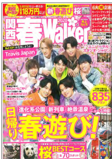
関西春ウォーカー 2月下旬発売

2月下旬発売予定「関西春ウォーカー」と「関西ウォーカー」の純広告1ページがセットとなったお得な企画です。 関西ウォーカーは2月20日発売号、3月19日発売号の2号が対象となります。