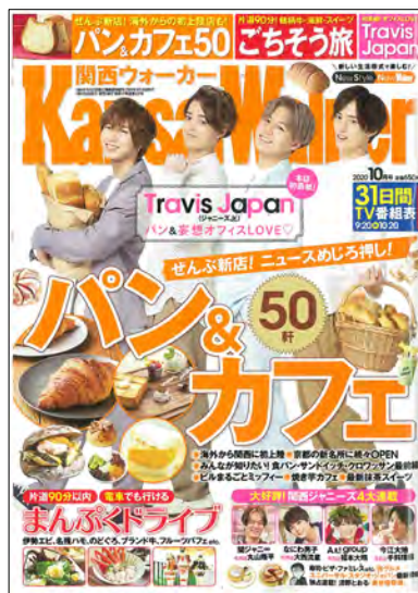
関西ウォーカー2/20 or 3/19 発売号