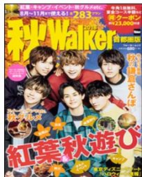
※昨年表紙は「超特急」