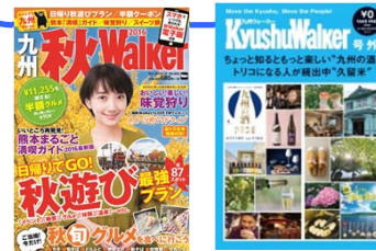
福岡県内のTSUTAYAに設置している フリーペーパーとのセット