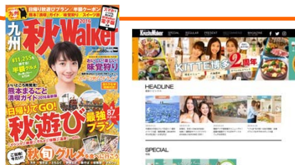
雑誌とWEB記事セット