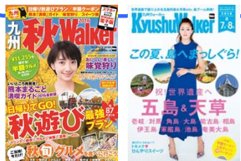
お得な雑誌セット