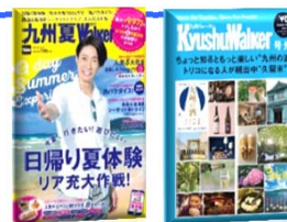
福岡県内のTSUTAYAに設置している フリーペーパーとのセット