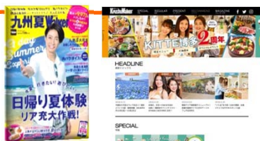
雑誌とWEB記事セット