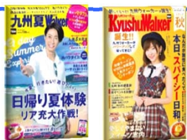
お得な雑誌セット