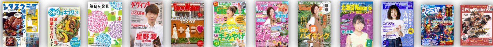
レタスクラブ 3分クッキング 毎日が発見 ダ・ヴィンチ TokyoWalker KansaiWalker TokaiWalker YokohamaWalker 北海道Walker KyushuWalker ファミ通 電撃PlayStation

「レタスクラブ」「3分クッキング」「毎日が発見」「ダ・ヴィンチ」「東京ウォーカー※」 「関西ウォーカー」「横浜ウォーカー」「東海ウォーカー」「北海道ウォーカー」「九州ウォーカー」 「週刊ファミ通」「電撃PlayStation」