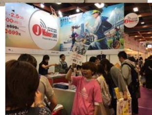
ブース壁面パネルを使用したPRなど