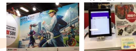
パネル展示・アンケート