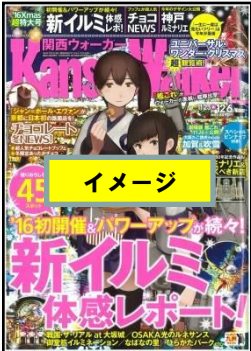
神戸ルミナリエウォーカー