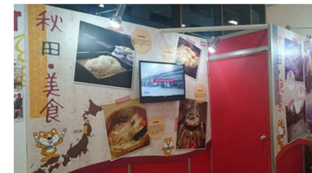
【ディスプレイで動画配信】