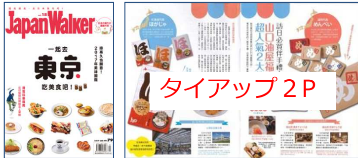
JapanWalker (1/1) 表紙