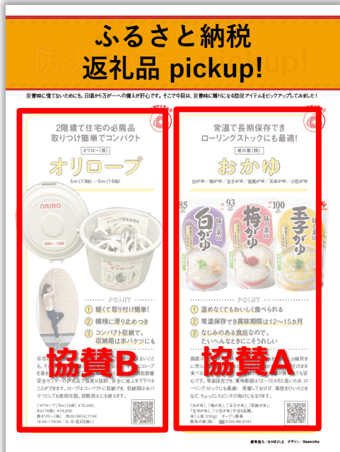
※タイアップ誌面はイメージです。