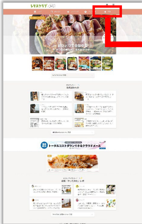
レタスクラブWEB TOPページ