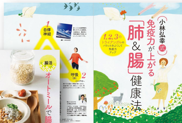
特集記事イメージ

毎日の食事や、ちょっとした生活習慣へのプラスで、 健康・美容の効果が期待できる「腸活」 は、 毎回支持率の高い人気のテーマ です。今回は、医師や学者、栄養士・料理家などの専門家の監修のもと、食べ物や便秘解消・免疫力アップなど様々な切り口で「美腸・腸活」を特集していきます。