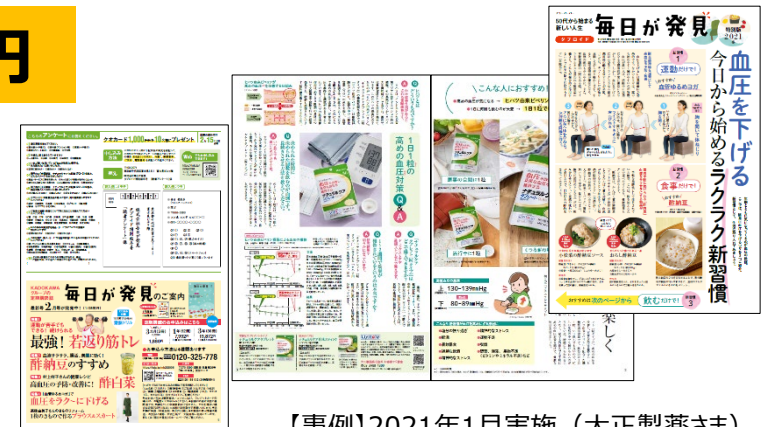
【事例】2021年1月実施（大正製薬さま）