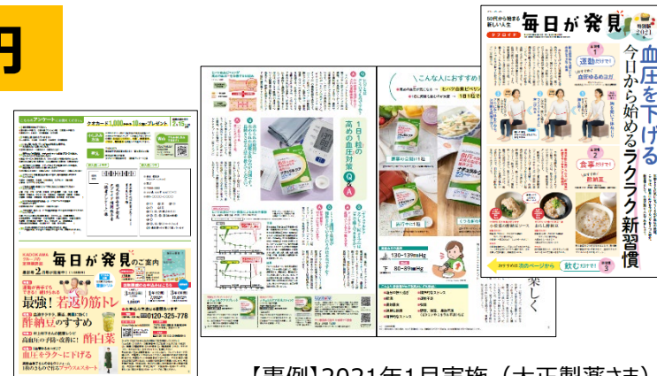
【事例】2021年1月実施（大正製薬さま）