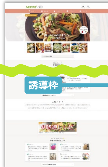
トップページほか