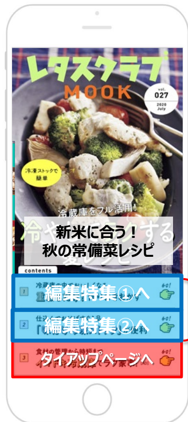
「レタスクラブMOOK」 定時配信面

140万人を超えるLINEレタスクラブMOOK登録者に向けて、圧倒的なリーチ確保が期待できます。